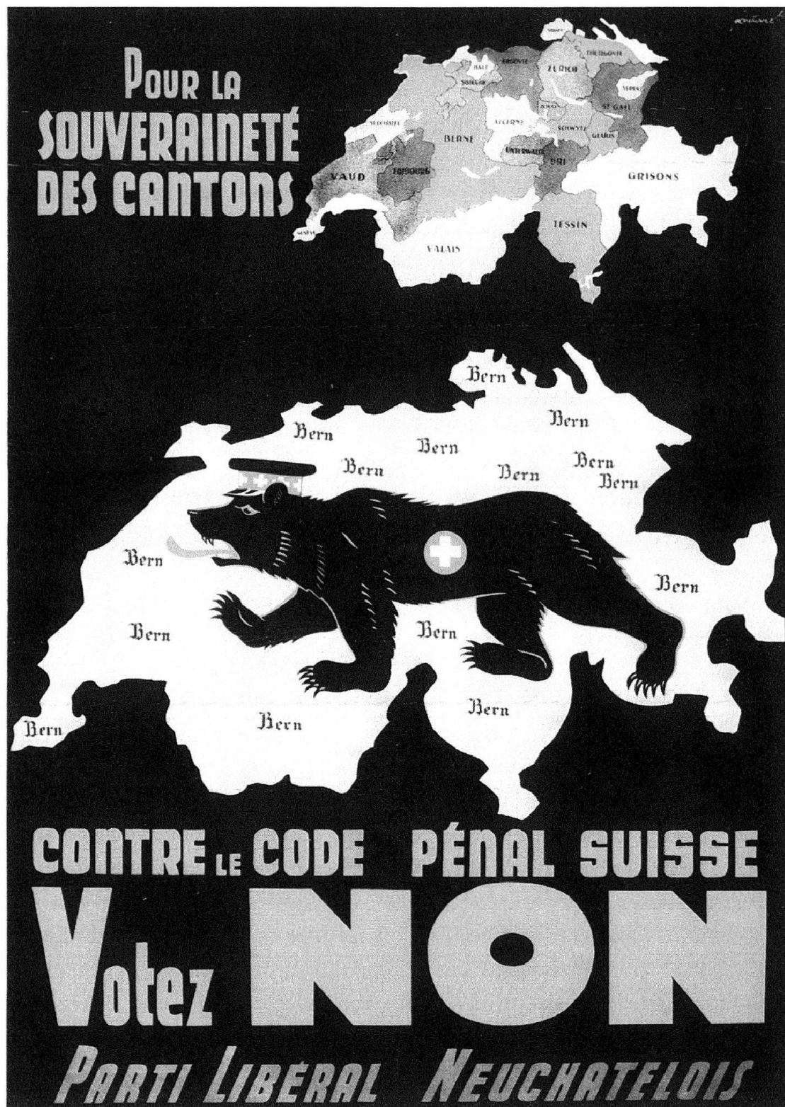
Fig. 4: L'ours bernois, symbolisant l'État fédéral centralisateur, connaît une véritable postérité graphique en Suisse, notamment à l'occasion de votations populaires comme celle qui a suscité cette affiche de Noël Fontanet dans les années 1930.