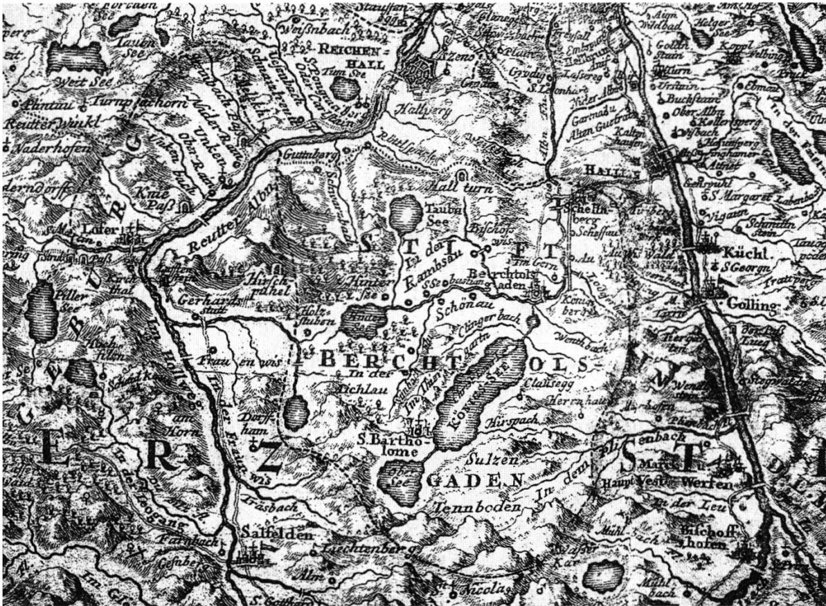
Abb. 1: Konkurrenz auf engem Raum: Reichenhall – Hallein – Berchtesgaden.

Standortvor- und -nachteile ohne Rücksicht gegeneinander ausgespielt. Der vorliegende kurze Aufsatz versucht, die Eckpunkte dieses Konkurrenzkampfes für die Zeit des Mittelalters und der Frühen Neuzeit zu skizzieren.