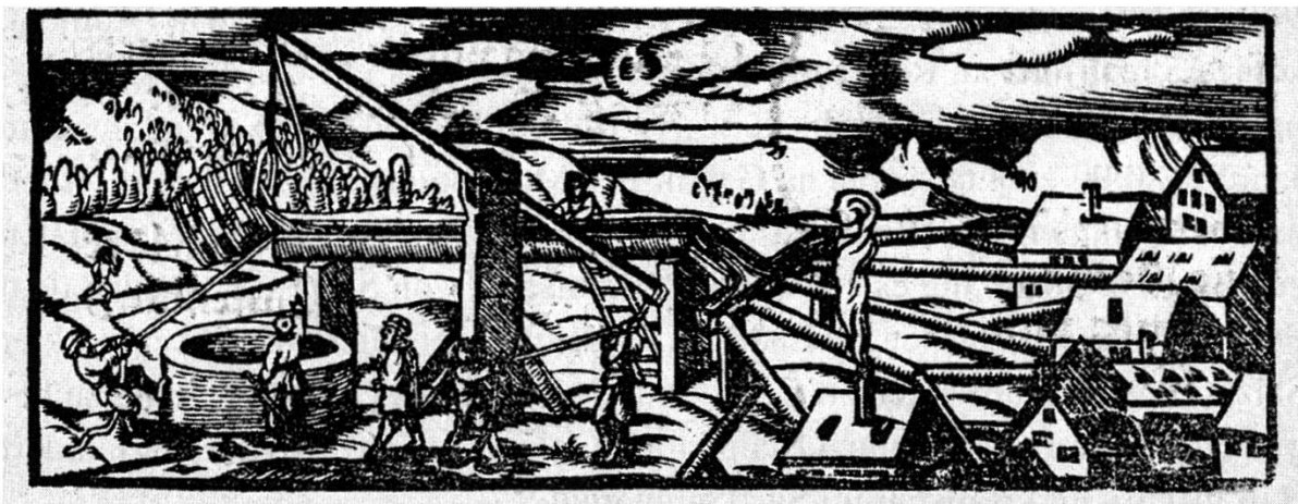
Abb. 2: Ressource Bodenschätze: In Form natürlichen Salzwassers wurde in Reichenhall Sole aus dem Brunnen geschöpft.

die Gebiete des Ostens vordrang, die in der frühmittelalterlichen Chronistik Mitteleuropas noch als terrae incognitae galten.