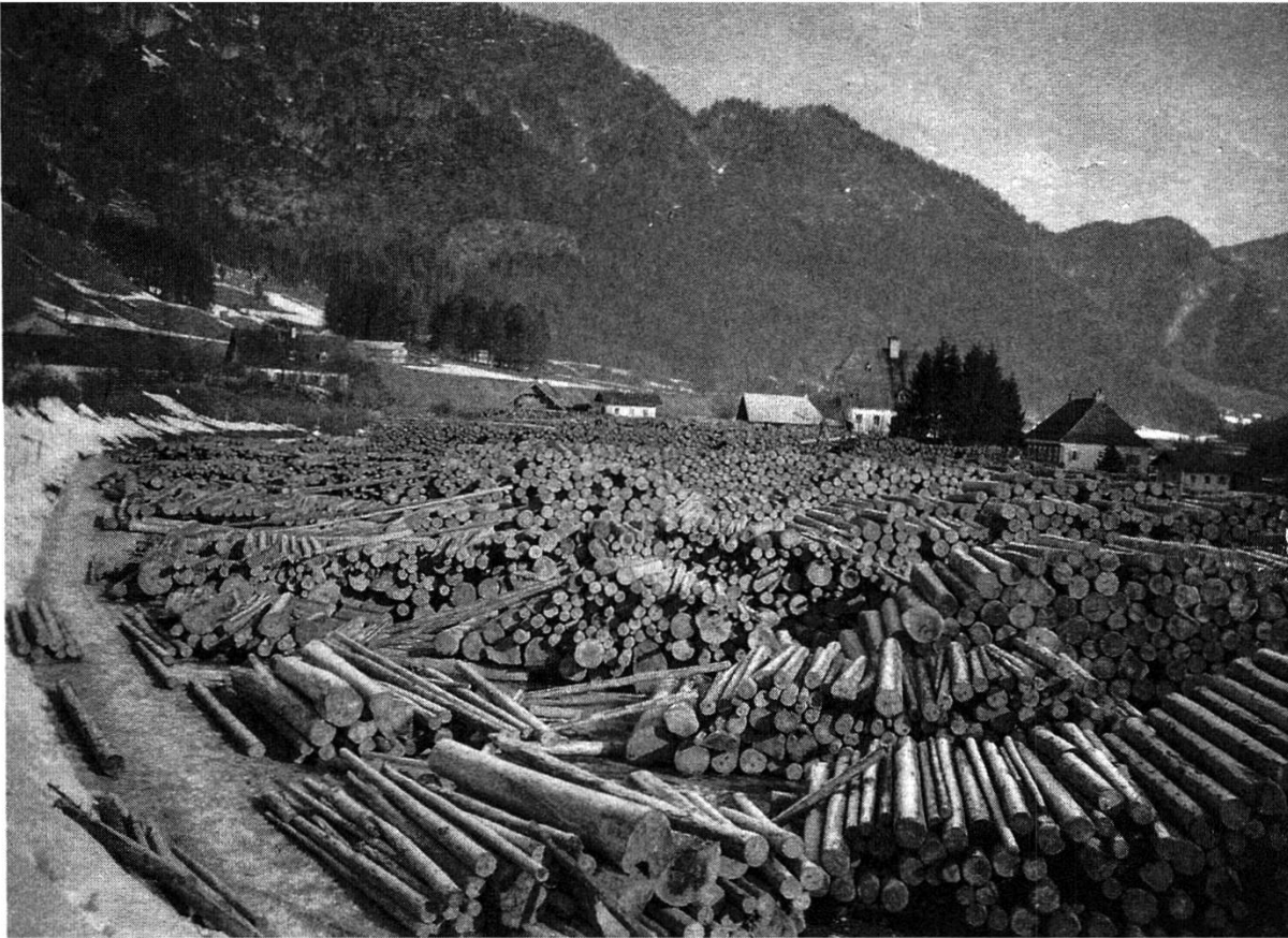
Abb. 4: Ressource Energie. Die Wälder entlang der Saalach waren zur Reichenhaller Saline gewidmet.