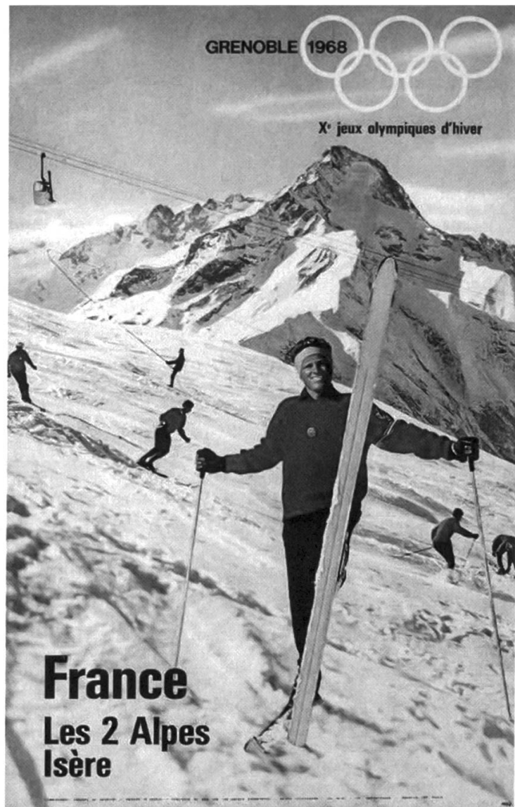
Fig. 2: Affiche «Les 2 Alpes» pour les X e jeux Olympiques d'hiver, 98,5 × 63,0 cm. Imprimé en France par le Commissariat général du tourisme (Grenoble), 1968.

la fois un emblème et un outil de promotion renvoyant à son image de pureté immaculée, dont les champs de neige ou les pâturages rappellent régulièrement la véracité, constitue bien un motif pionnier d'investissement au côté d'un principe de performance exemplifié par la conquête des sommets à partir du XVIII e siècle par l'intermédiaire de l'intérêt porté à l'alpinisme. 10