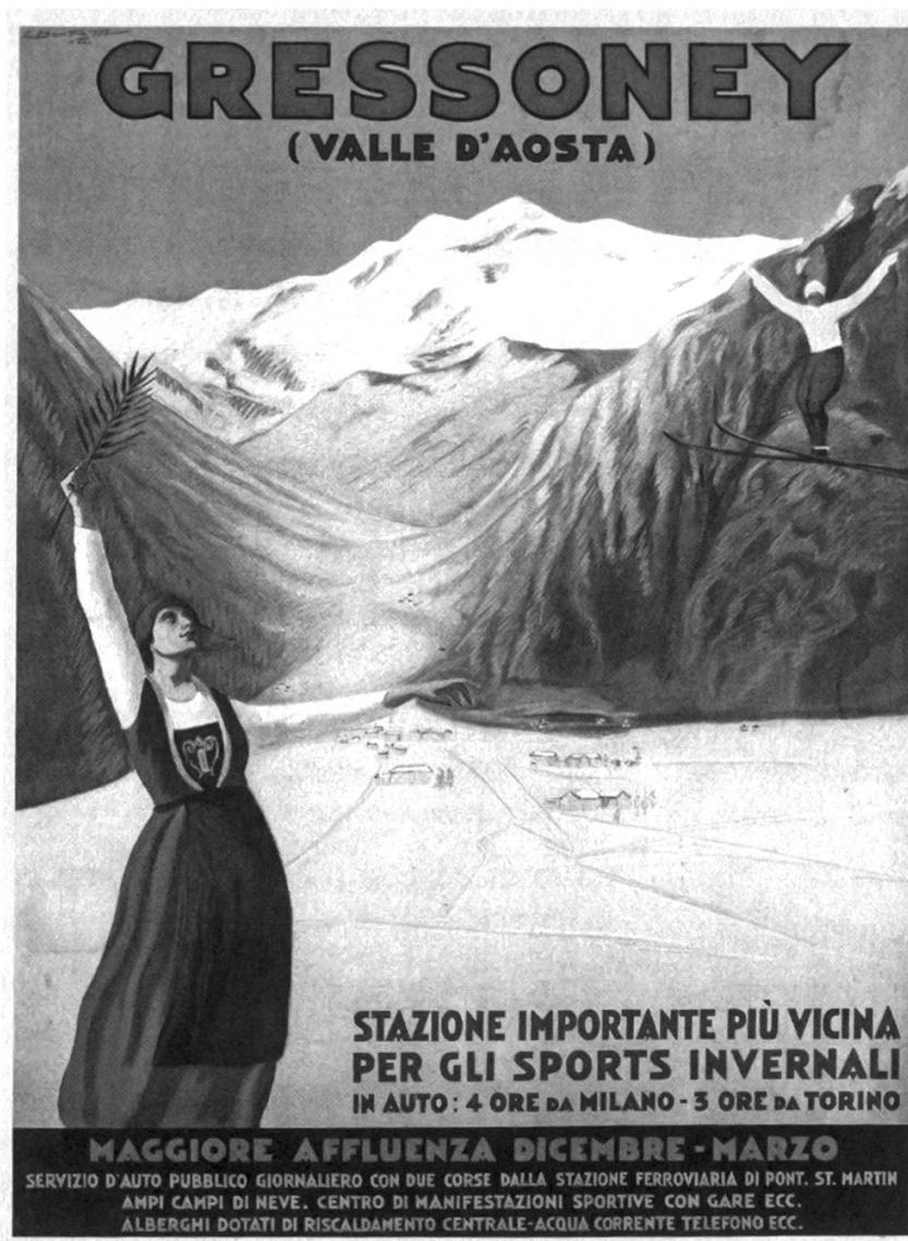
Fig. 2: Manifesto di C. Bonfatti (1929).

una cultura automobilistica e perciò funzionale ad un accesso esclusivamente in auto. Auto e sci nascono praticamente insieme: quando nel 1904 l'ingegner Kind cominciava ad aggregare i primi sciatori, a Torino circolavano 145 vetture e la Fiat, nata nel 1899, cominciava a dare segni di buon sviluppo; hanno quindi in comune «una visione diffusa squisitamente modernista, basata su un certo modo di vivere e consumare il territorio alpino». 23 E Sestriere ne è l'esempio più evidente: la conformazione del terreno, favorevole allo sci, ha indotto negli anni Trenta il Senatore Agnelli, presidente della Fiat, a far progettare una località sciistica di alto livello qualitativo con lo specifico scopo di far raggiungere rapidamente i campi di sci all'alta borghesia torinese con quei mezzi che negli anni Trenta cominciavano a diffondersi nelle classi più agiate. Nella stessa logica di Sestriere in tempi successivi si sono sviluppate molte località