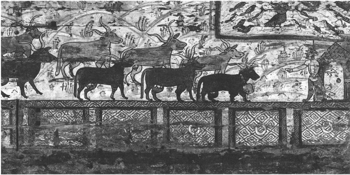
Abb. 1: Bohlenmalerei des 16. Jahrhunderts aus einem abgebrochenen Haus in Gais AR. Maler unbekannt. Stiftung für appenzellische Volkskunde, Herisau, ausgestellt im Volkskunde-Museum Stein AR.

sogenannten Bauernmalerei des 18. und 19. Jahrhunderts (Abb. 2). Sie zeigt die Ankunft der Kuhherde auf der Alp, wo die Tiere für einige Wochen geweidet werden, bevor sie wieder ins Tal zurückkehren. Diese Malerei wirft ein Schlaglicht auf die grosse Bedeutung der Viehwirtschaft in der Geschichte der Ostschweiz. Ziel dieses Beitrags ist, zu zeigen, dass die ostschweizerische Alpwirtschaft einen wichtigen Anteil an der seit dem ausgehenden Mittelalter bereits stark kommerzialisierten und immer intensiver geförderten Viehwirtschaft hatte. Unter dem Begriff Alpwirtschaft wird der auf die Sommermonate beschränkte Aufenthalt des Viehs mit Hirten auf den Bergweiden verstanden. Dabei handelt es sich um eine von der Hauptsiedlung weitgehend abgesonderte Betriebsweise, die aber mit dieser in einem rechtlichen und wirtschaftlichen Zusammenhang steht. 1 Zeitlich wird ein Bogen vom 15. ins 16. Jahrhundert geschlagen. Als Quellengrundlage dienen hauptsächlich Pergamenturkunden und Alpsatzungen, ergänzt durch die historische Literatur. Thematisiert werden nebst der rechtlichen Organisation der Alpwirtschaft auch die Produktion und der Handel von Alpprodukten, denn Käse, Butter und Vieh dienten der Versorgung der gesamten Bevölkerung, das heisst der ländlichen wie der städtischen. Am Beispiel der Alpwirtschaft kann gut gezeigt werden, wie eng die ländliche, voralpine/alpine Wirtschaft des Mittelalters und der Frühen Neuzeit mit jener von städ-