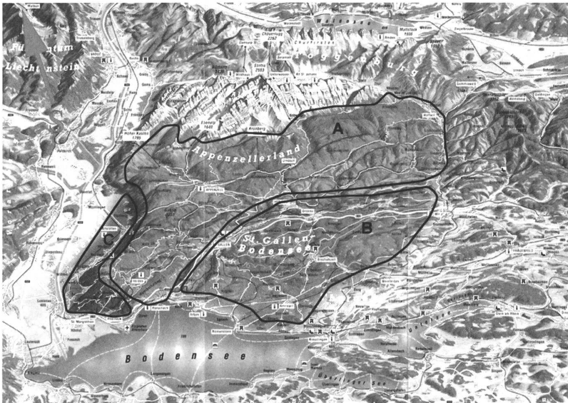
Abb. 3: Die landwirtschaftlich unterschiedlichen Zonen in der spätmittelalterlichen Region Ostschweiz: A = Viehwirtschaft; B = Getreidebau; C = Weinbau.