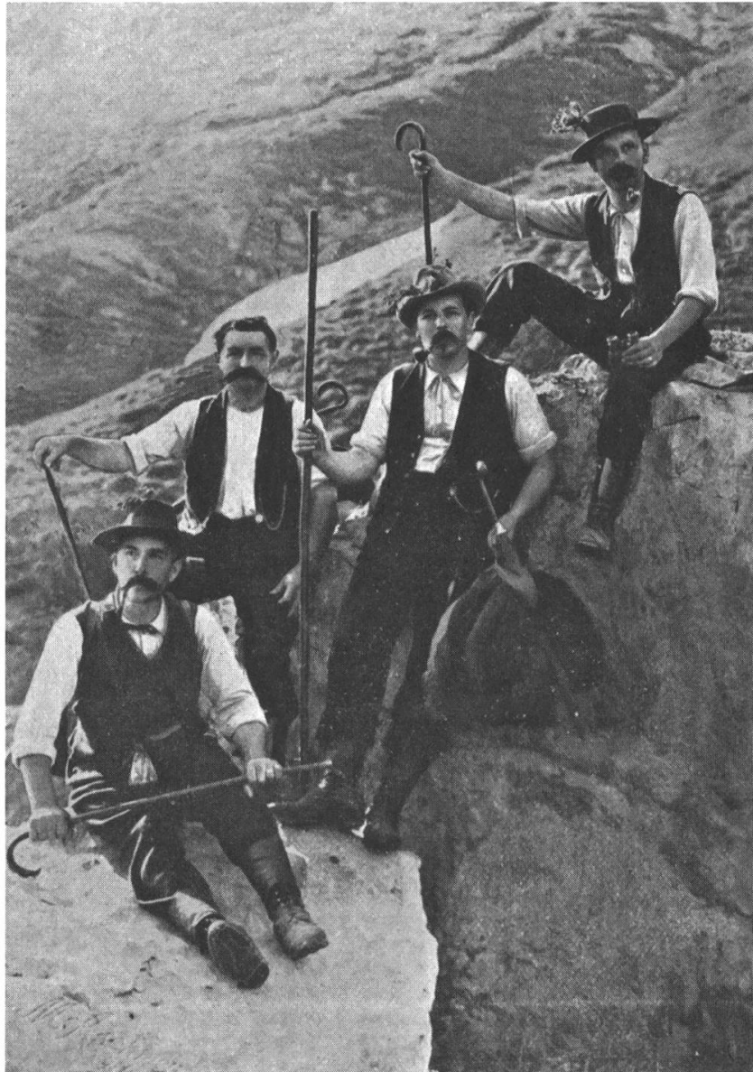
Abb. 3: Alpinspektion im Gebiet der Korporation Uri mit Vertretern von Korporation, Kanton und anderen lokalen Organisationen. Quelle: Ambros Püntener: Alpinspektions-Bericht der Korporation Uri 1905–1908, Altdorf 1909.