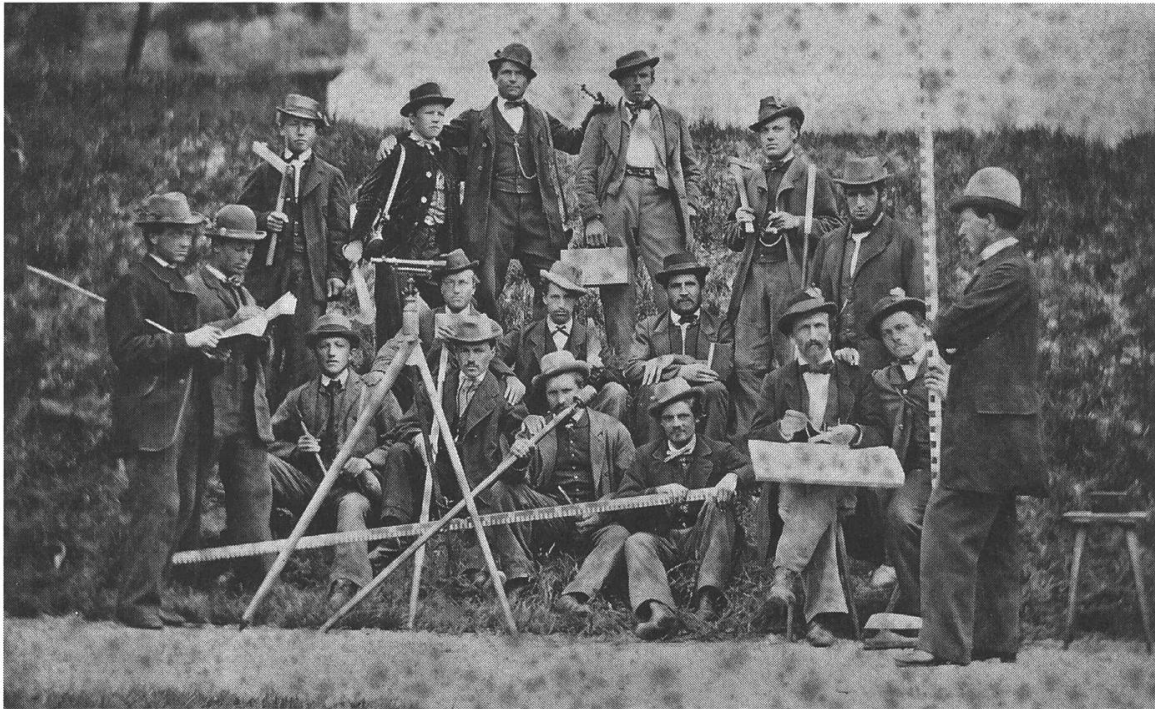
Abb. 1: Kantonaler Forstkurs 1868 unter Leitung von Forstinspektor Johann Coaz.

Welche Brisanz aus diesem Gegensatz hervorging, zeigt schon die Tatsache, dass sich in sämtlichen Gebirgskantonen mindestens 80 Prozent der Waldflächen als Gemeinde- oder Korporationswälder in kollektivem Besitz befanden. 33 Wie wir sehen werden, suchten die Forstmodernisierer aber nicht in erster Linie die Konfrontation, sondern teilten Kasthofers Einsicht in die Beschränkungen einer Politik von oben. Es ist bezeichnend, dass sich der SFV in dieser Perspektive immer wieder mit den kollektiven Wäldern und dem Bedarf der ländlichen Bevölkerung befasste. So warf er an seiner Jahresversammlung 1850 die Fragen auf, welches für Gemeinden und Korporationen der «zweckmässigste» Waldwirtschaftsplan sei, in welchem Alter die Jungwuchsflächen «dem Weidange geöffnet werden und wie der Förster angesichts der wachsenden Bevölkerung gleichzeitig den Forderungen der Landwirtschaft entsprechen» könne, «ohne den Holzzuwachs zu schwächen». 34