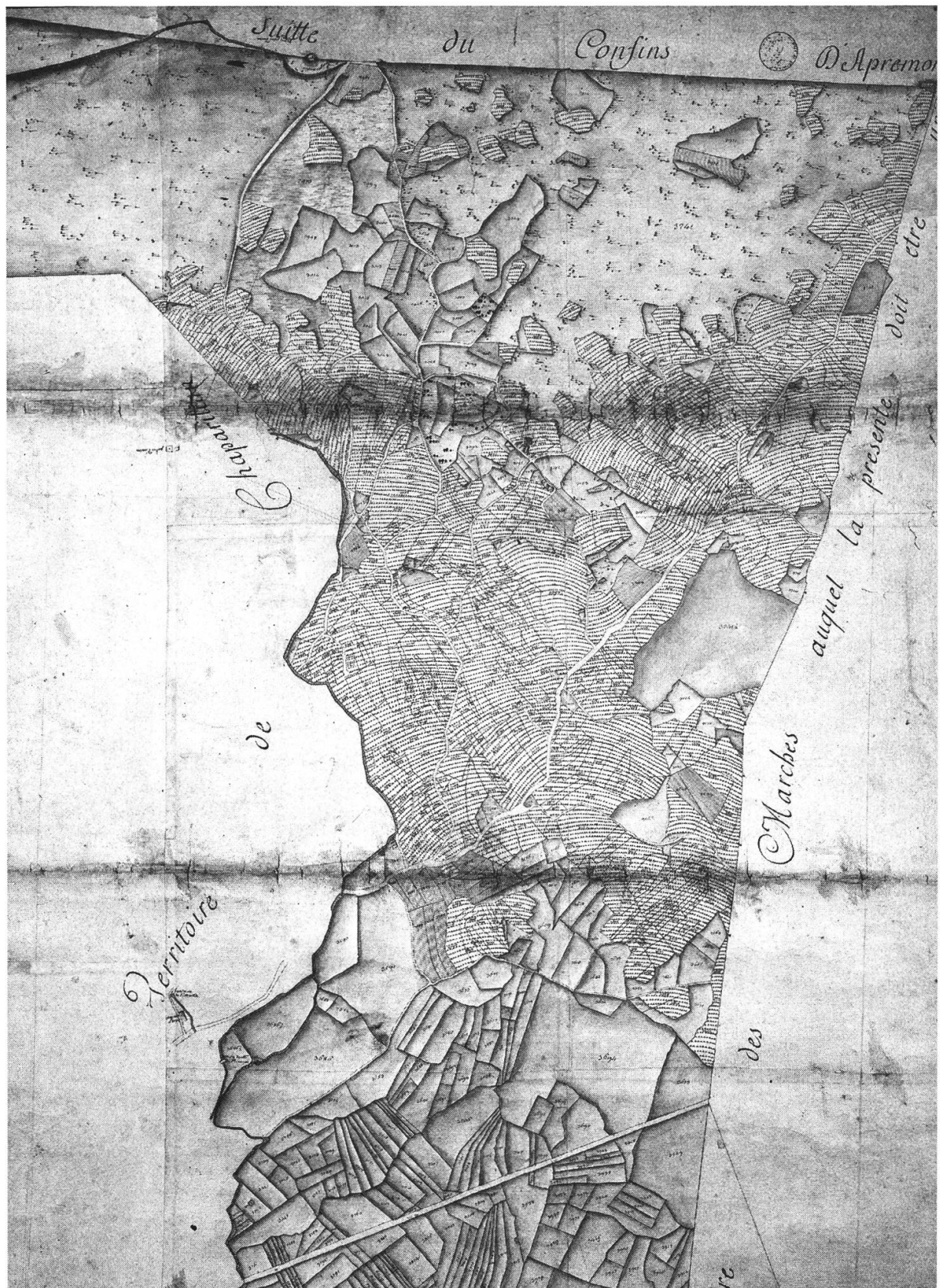
Fig. 1: Mappa catastale degli Abymes nel territorio di Les Marches; si possono notare le vigne frammiste ad aree boschive e prative (1760).