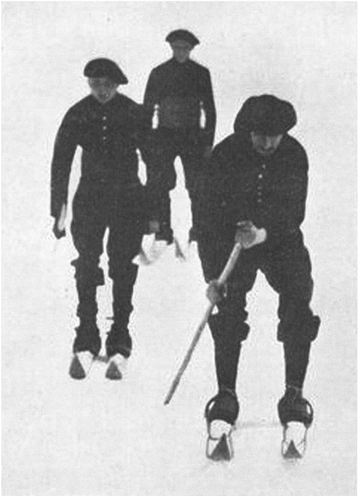
Fig. 3: Chasseurs alpins réalisant une descente à ski.