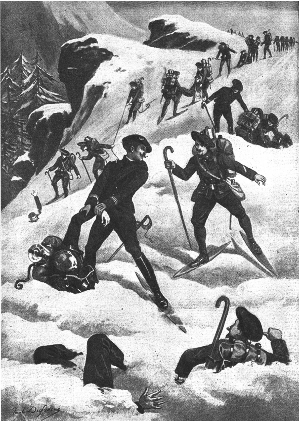
Fig. 2: Sauvetage en skis.