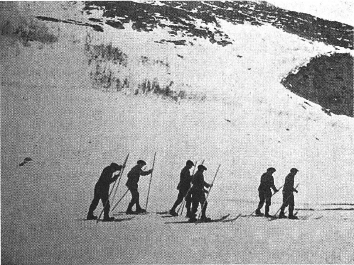
Fig. 1: Première photographie de l'utilisation de skis par l'armée française au poste des Chapieux, Source: Le Figaro illustré, mars 1898. Cette photographie est issue d'un reportage du journaliste Ardouin-Dumazet réalisé en 1897 ou 1898, BNF.

ensuite Victor-Eugène Ardouin-Dumazet, auteur de guides touristiques, qui relate son séjour forcé en compagnie de chasseurs alpins au poste des Chapieux (Haute-Tarentaise) en février 1897. Bloqués par des avalanches, les alpins de ce poste «y vivent heureux, ils parlent avec passion de leurs courses sur la neige, au moyen de raquettes ou même de skis norvégiens qui commencent à être utilisés et permettent de faire rapidement de longues courses.» 48 La même année il semble qu'Henri Dunod ait lui aussi réalisé des essais de ski dans le secteur du Lautaret. 49