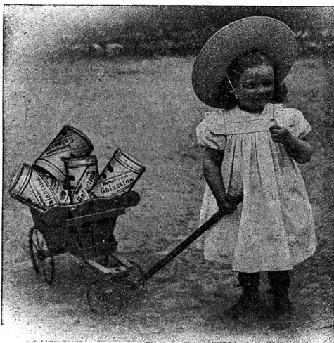
Galactina für das Brüderchen.

Einen grossen Fehler begehen diejenigen Mütter, die ihre Kinder einzig mit Kuhmilch auferziehen, da bekanntlich der besten Kuhmilch die Knochen und Muskel bildenden Bestandteile fehlen. Vom dritten bis zum zwölften Monate benötigt ein jedes Kind eine Beinahrung. Man gebe ihm daher dreimal täglich, zuerst in der Saugflasche, später als Brei, das vorzügliche, zur Hälfte aus Alpenmilch bestehende