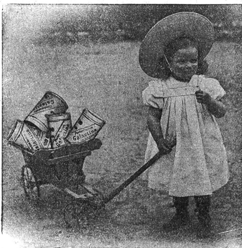
Galactina für das Bräuerchen.

Kinderkrippe Winterthur schreibt: Ihr Kindermehl wird in unserer Anstalt seit 1½ Jahren verwendet und zwar mit bestem Erfolg. Die mit Galactina genährten Kinder gedeihen vorzüglich und da wo Milch nicht vertragen wird, leistet Galactina uns in den meisten Fällen bessere Dienste als Schleim.