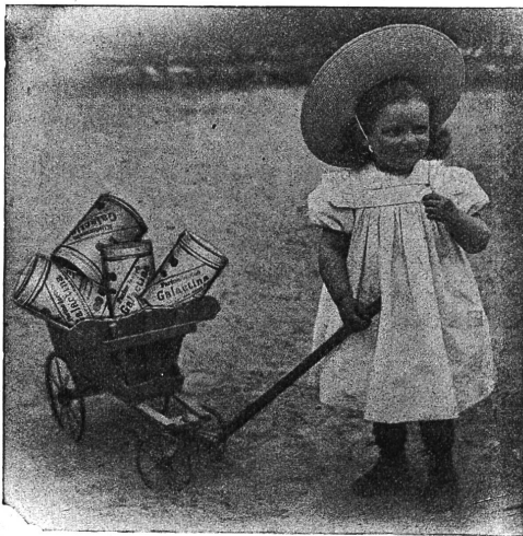
Galactina für das Brüderchen.

Länggasskrippe Bern schreibt: Wir verwenden seit Jahren Galactina in allen Fällen, wo Milch nicht vertragen wird; selbst bei ganz kleinen Kindern hat sich in Krankheitsfällen Galactina als lebensrettend bewährt. Sehr wertvoll ist Galactina in Zeiten, wo nasses Gras gefüttert wird, auch während der grössten Hitze, wo trotz aller Sorgfalt die Milch sehr rasch verdirbt.