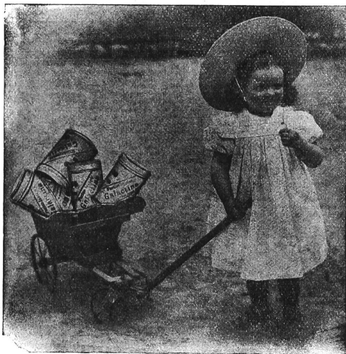
Galactina für das Bräuerchen.

Kinderkrippe Winterthur schreibt: Ihr Kindermehl wird in unserer Anstalt seit 1 1/2 Jahren verwendet und zwar mit bestem Erfolg. Die mit Galactina genährten Kinder gedeihen vorzüglich und da wo Milch nicht vertragen wird, leistet Galactina uns in den meisten Fällen bessere Dienste als Schleim.