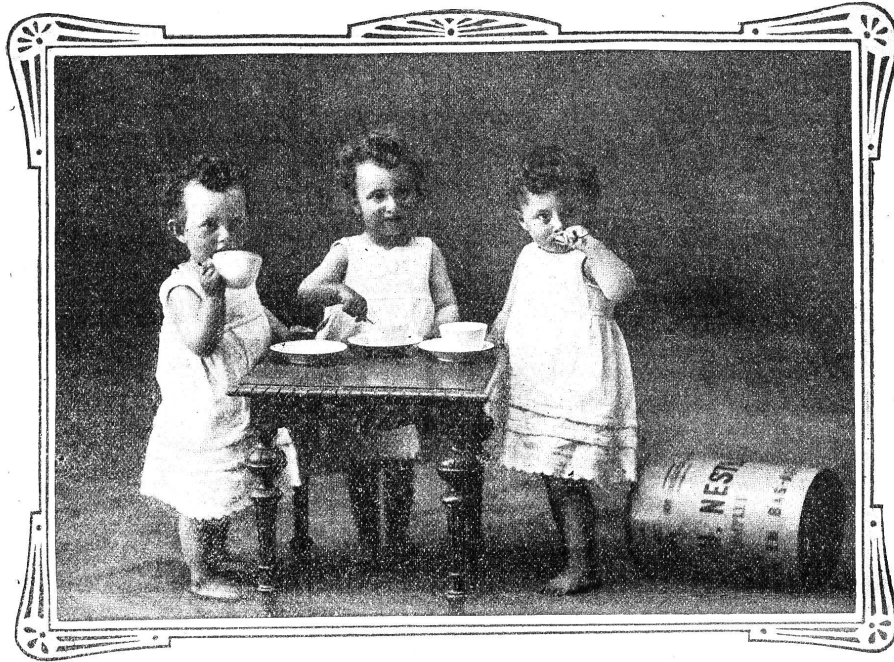
VEVEY, 10. Juli 1909.

Ich sende Ihnen unter aufrichtigster Dankesbezeugung die Photographie meiner Drillingsknaben, welche durch Nestlé's Kindermehl gerettet wurden.