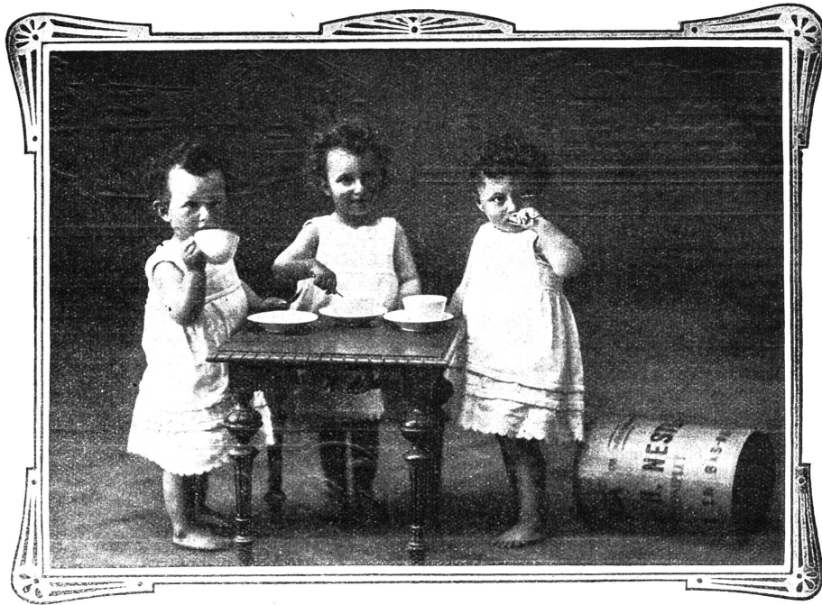
VEVEY, 10. Juli 1909.

Ich sende Ihnen unter aufrichtigster Dankesbezeugung die Photographie meiner Drillingsknaben, welche durch Nestlé's Kindermehl gerettet wurden.