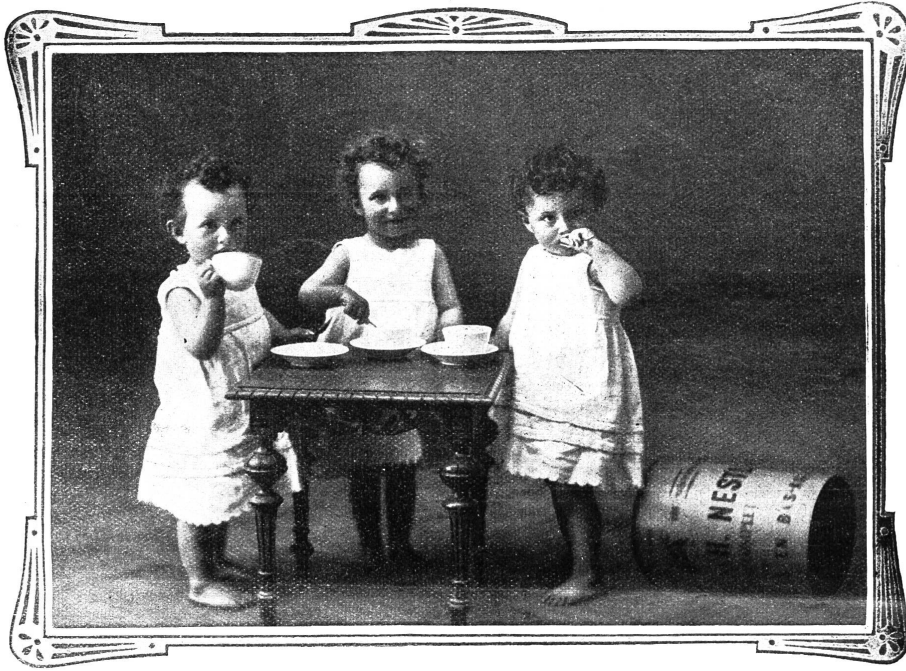
VEVEY, 10. Juli 1909.

Ich sende Ihnen unter aufrichtigster Dankesbezeugung die Photographie meiner Drillingsknaben, welche durch Nestlé's Kindermehl gerettet wurden.