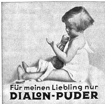
Für meinen Liebling nur DIALON-PUDER