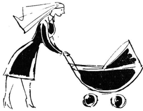
Milchmehl aus Guigoz-Milch, Zwieback, Zucker und Phosphaten

Vergessen Sie nie uns von Adressänderungen jeweilen sofort Kenntnis zu geben, unter Angabe der alten wie der neuen Adresse, da wir nur dann für richtige Zustellung garantieren können