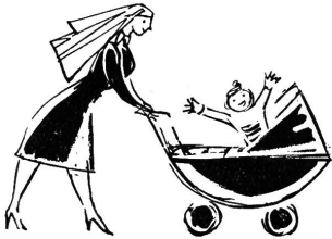
Der ideale Zusatz zur Guigoz-Milch vom 4. Monat an