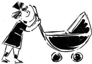
Bedeutet eine zum Wachstum notwendige Bereicherung der Säuglingskost