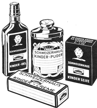
Dr. Gubser-Knoch AG. Schweizerhaus, Glarus zuverlässige Heil- und Vorbeugungsmittel für die Pflege des Säuglings und des Klein- kinds. Tausendfach erprobt und bewährt.