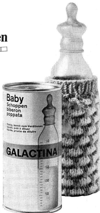
Die Dose mit 450 g Inhalt reicht, je nach Alter des Säuglings, für 5-10 Schoppenmahlzeiten. Detailpreis Fr. 2.40.