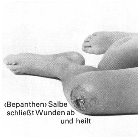
«Bepanthen» Salbe schließt Wunden ab und heilt