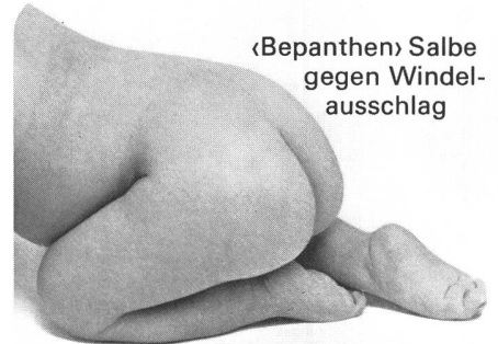
«Bepanthen» Salbe gegen Windel- ausschlag