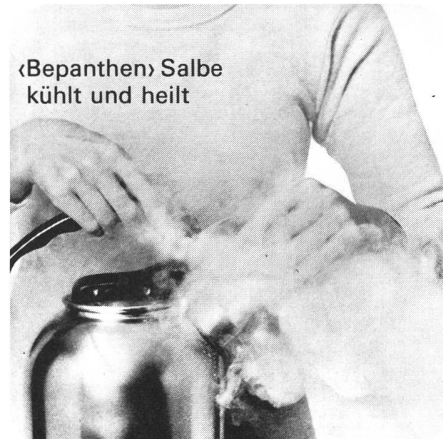
«Bepanthen» Salbe kühlt und heilt