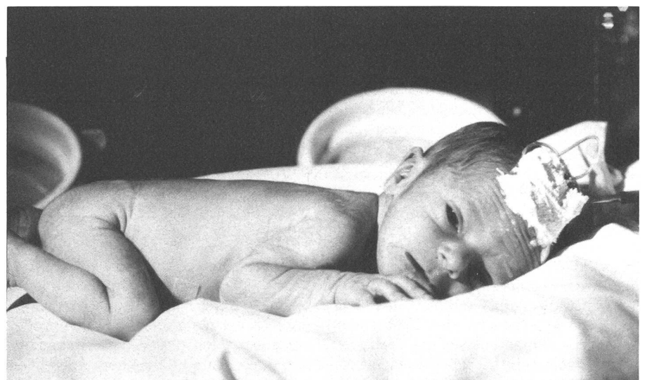
Terminmangelgeburt: sorgenvoller, älthlicher Gesichtsausdruck.