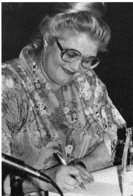
Sheila Kitzinger 1982 bei den Zürcher Hebammen

Am eindrücklichsten waren sie bei Frauen mit Hyperventilation und mit Einstellungsanomalie der Kinder.