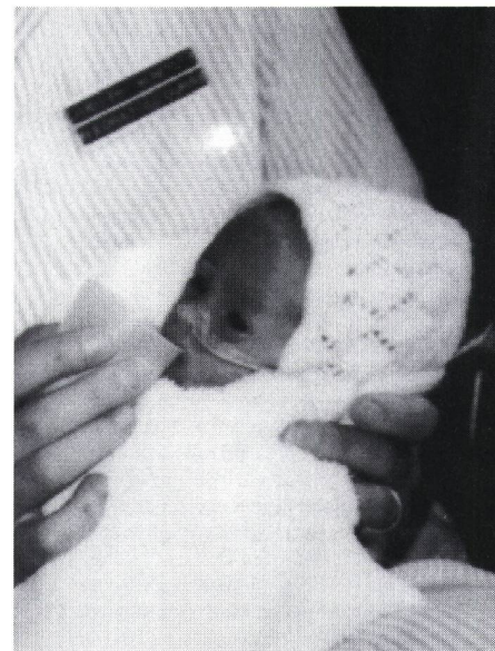
Füttern mit dem AMEDA Baby-Cup

trinken, bleibt der Becher auf der Unterlippe ruhen. Denn es ist wichtig, dass das Baby seine Trinkmenge und Trinkzeit selber bestimmen kann.