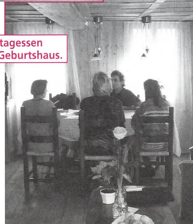
Mittagessen im Geburtshaus.