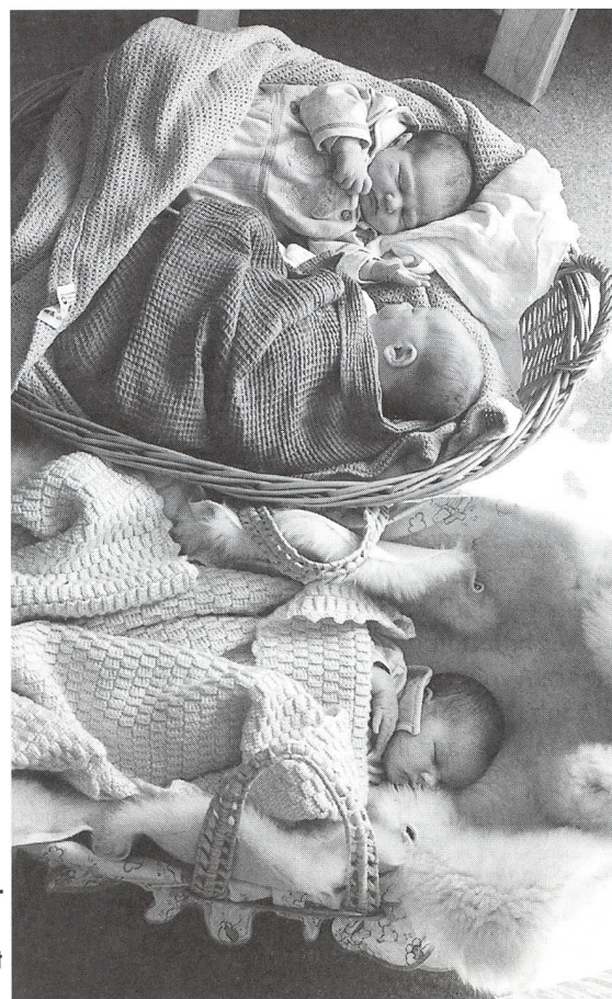
Ihr SIDS-Risiko ist dank Rücken- und Seitenlage um 50 Prozent kleiner.