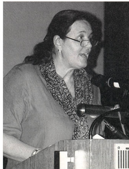
Invitée d'honneur de cette édition: Madame Maria Spornbauer, sage-femme autrichienne et actuelle présidente de la Confédération internationale des sages-femmes (ICM).

Il y a quatre stades en matière de prévention. La prévention primaire comprend les mesures qui servent à la