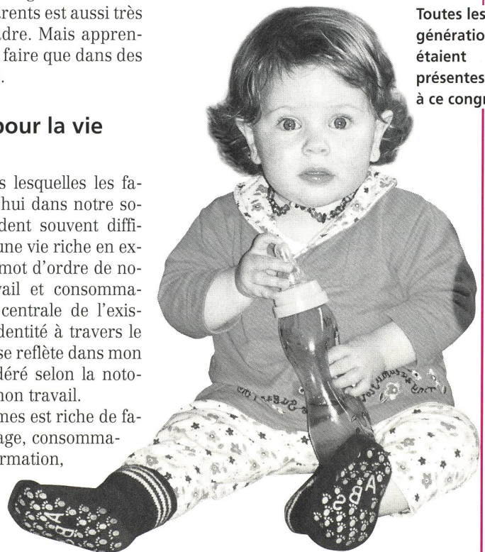
Toutes les générations étaient présentes à ce congrès!

L'OMS a défini en 1957 la dépendance ainsi: «c'est un état d'empoisonne-