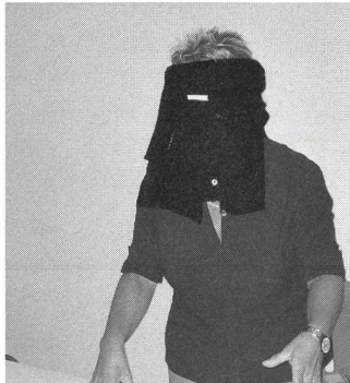
So blind war schon lange keine Glücksfee mehr!

Insgesamt 327 Leserinnen der Schweizer Hebamme, 290 aus der Deutschschweiz und 37 aus der Romandie,