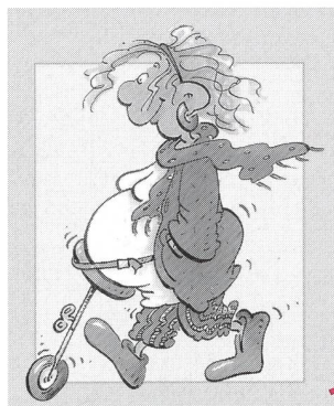
Cartoon: Barbara Hörnberg

Die Kunde von Osteopathie und Cranio- sacral-Therapie als wirkungsvolle kom- plementärmedizinische Therapien auch für Schwangere, Gebärende und ihre Neugeborenen dringt in letzter Zeit vermehrt an die Öffentlichkeit – nicht zuletzt auch dank dem zunehmenden Interesse der Publikumsmedien für die- se Heilmethoden. Besonders die Cra- niosacral-Therapie bietet Hebammen ein vielversprechendes Gebiet an, in dem sie sich zusätzlich professionell profilieren können.