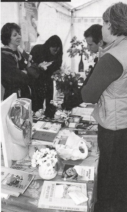
Le stand de la section Fribourg de la FSSF