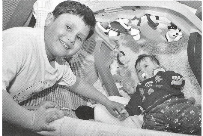
Fr. 15.- par jour et par enfant: une allocation enfin équitable

pour enfants de 15 francs par jour et par enfant sont équitables.