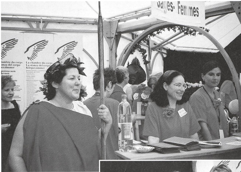
Helvetia hält an der Hebammenbar Wache.

Am 14. Juni, Jahrestag des legendären Frauenstreiktages von 1991, strömten gegen 10000 Besucherinnen und Besucher auf die Arteplage von Yverdon: ein Spitzentag! Magnet war das Purpurfest. Über den offensichtlichen Besuchererfolg hinaus ermöglichte das Fest die Begegnung von Tausenden von Frauen von unterschiedlichster Herkunft, Kultur, Sprache und Alter. Das Ereignis führte der Schweiz vor Augen, dass es uns Frauen gibt und auch, dass die erfolgreiche Expo-leitung von einer Frau geführt wird.