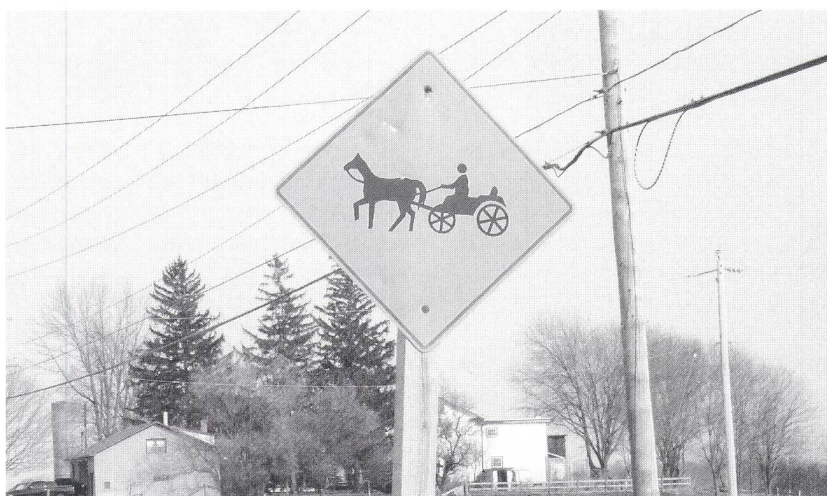
«On the road again...»