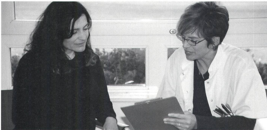
Im Gegensatz zum persönlichen Austrittsgespräch findet die schriftliche Klientinnenbefragung später und anonym statt.