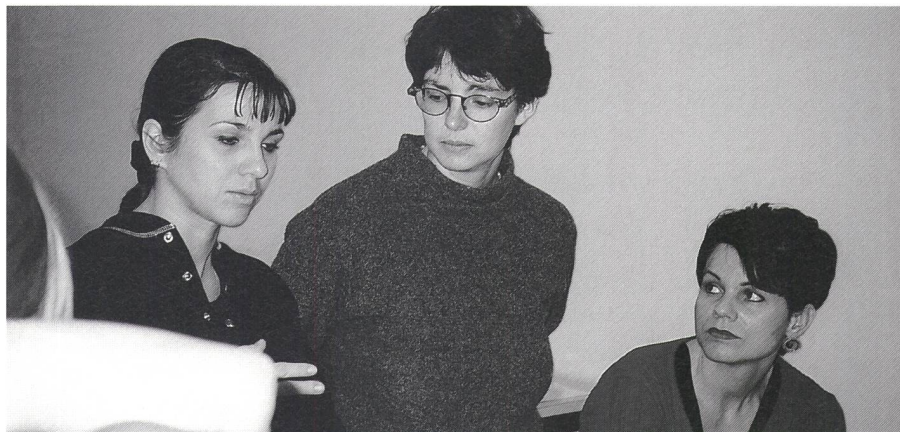
Auch Fallbesprechungen können Thema für Qualitätszirkel sein.

Noch eine Bitte zum Schluss. Einige Arbeitsgruppen/Qualitätszirkel haben sich ohne die Vermittlung des SHV gebildet und erarbeiten ebenfalls Dossiers zu Fachthemen. Ich wäre froh, wenn sich aus diesen Gruppen eine An-