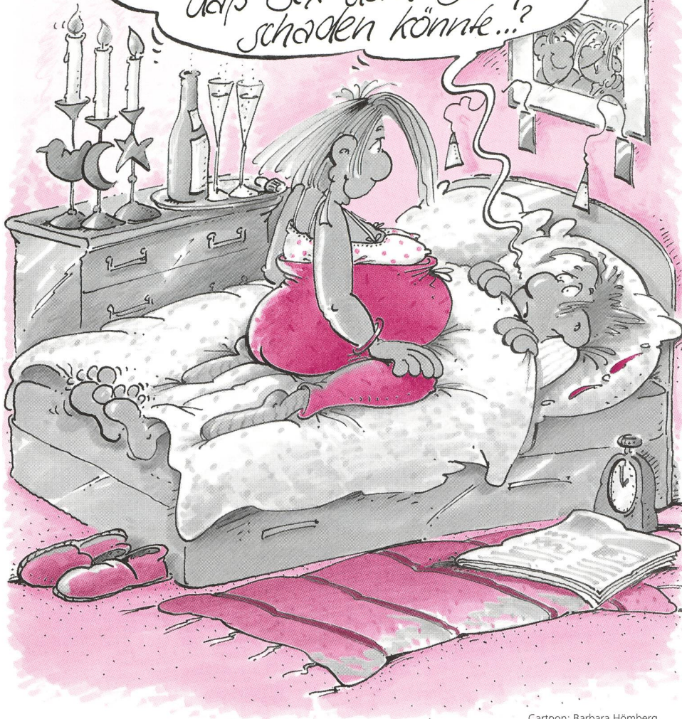
Cartoon: Barbara Hömberg

Ich finde deinen üppigen Körper zwar ausgesprochen erotisch, aber meinst du nicht auch, daß Sex dem Baby schaden könnte...?