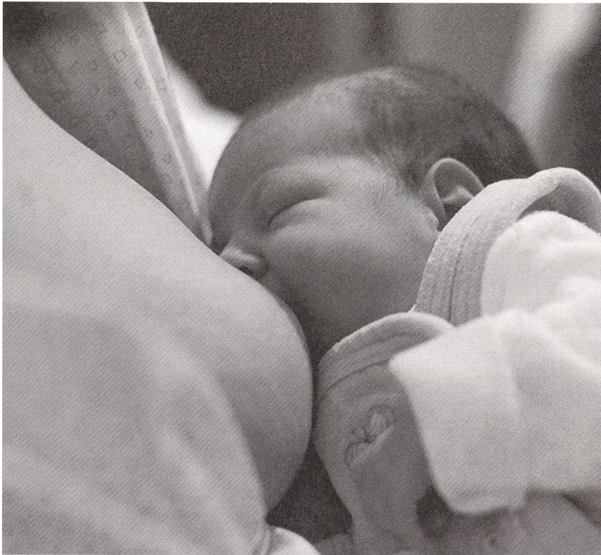
«Das Stillen hat mich so erfüllt, dass ich keine Lust mehr auf Sex hatte.»

ohne Episiotomie machten 7,7% der Erstgebärenden und 8,2% der Mehrgebärenden diese Angabe. Nach Episiotomie traten diese Beschwerden jedoch wesentlich häufiger auf: 47,4% nach medianer und 46% nach mediolateraler Episiotomie bei Erstgebärenden und 27,6% nach medianer und 16,3% nach mediolateraler Episiotomie bei Mehrgebärenden.