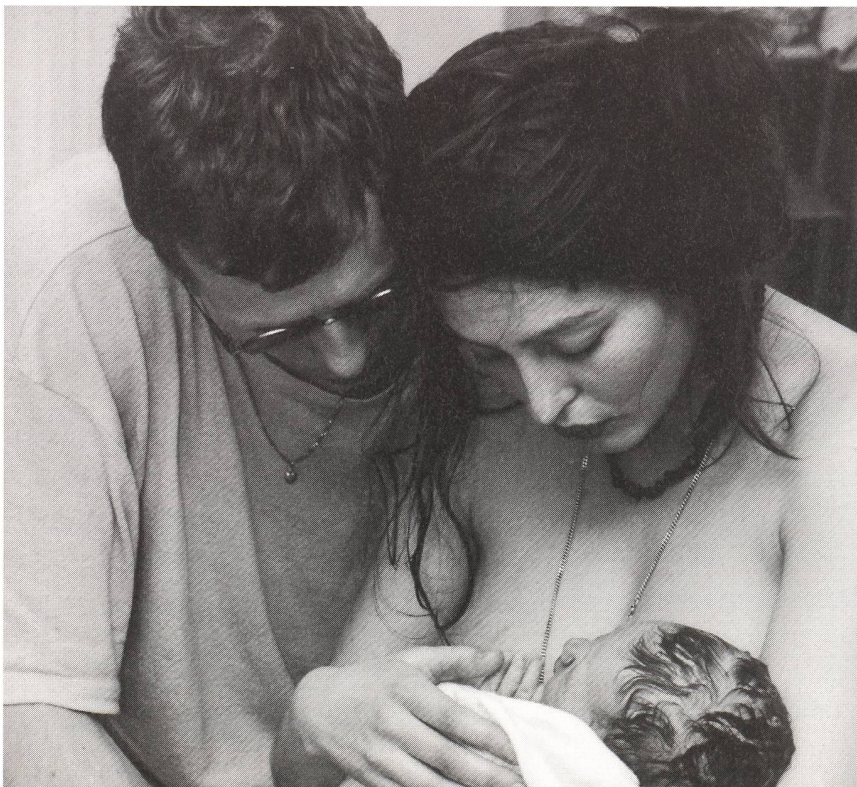
Eltern müssen für sich einen genügend grossen Teil an Zuwendung und Zärtlichkeit behalten.

Alle Partner empfanden in dieser Zeit eine gewisse Eifersucht, fühlten sich auch ausgeschlossen: