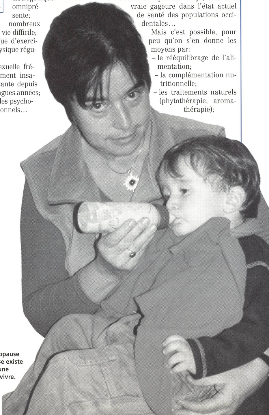
La ménopause heureuse existe et chacune peut la vivre.

La ménopause, délicate adaptation des régulations hormonales, demande un effort important à tout notre système glandulaire, et à l'hypophyse, qui en est le maître d'œuvre sous l'impulsion de l'hypothalamus, en particulier. Pas étonnant, dès lors, que certains bouleversements puissent se manifester, d'autant plus que tous les réajustements nécessaires se produisent alors que souvent