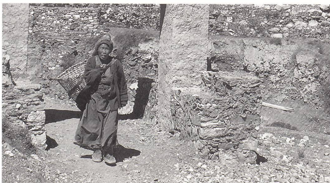
Egal ob hochschwanger oder gleich nach der Niederkunft: Eine Bäuerin auf dem Weg zur Feldarbeit.

In Kursen lernen Männer und Frauen, die Gründe für einen Uterusvorfall zu erkennen: Fehl- und Mangelernährung, der unhygienische Viehstall als Wochenbett, kurze Abstände zwischen den Schwangerschaften, vor allem aber die harte Arbeit und das Tragen schwerer Lasten auch hochschwanger und unmittelbar nach der Geburt.