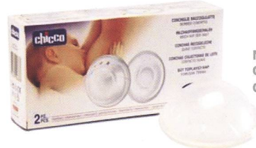
Milchauffangschalen / Coquilles recueil-lait Code 00073.20