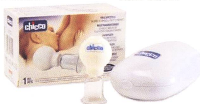
Brustwarzenformer / Tire-mamelon Code 00077.20