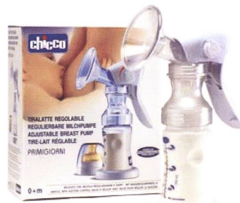
Milchpumpe / Tire-lait Code 69243