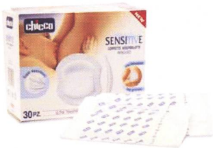
Stilleinlagen / Disques protège-seins Sensitive Code 69803-30 Stk.

CINQUE PRODUITS SPÉCIFIQUES, ÉTUDIÉ POUR FACILITER L'ALLAITEMENT