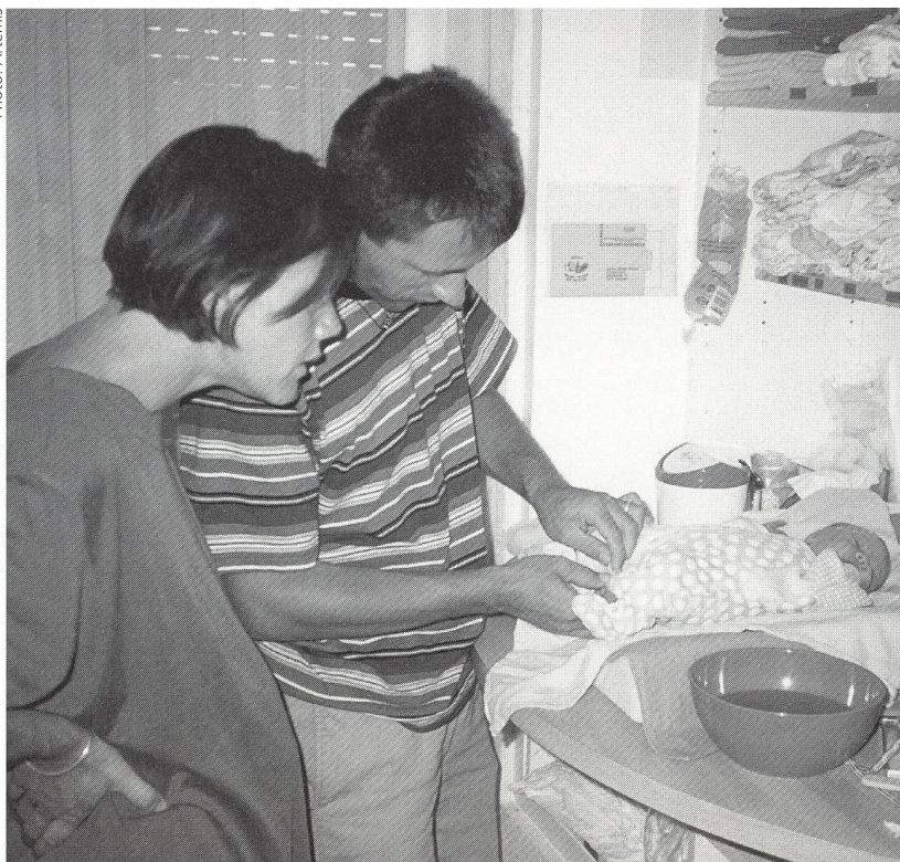
Même si elles le nient parfois, les femmes donnent sans compter. Elles ensèrent ainsi mari et enfants dans un réseau de liens affectifs, qui ne doit pas être explicité pour ne pas «être dénoué». Les hommes aiment mettre en route, dépanner, réparer.