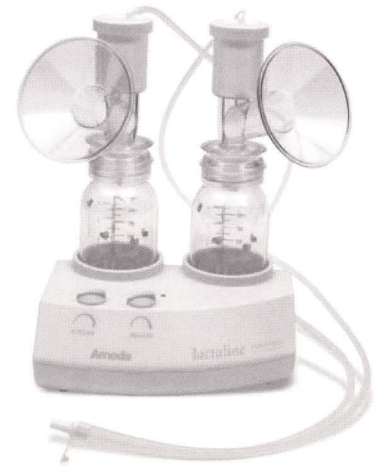
Modell: Lactaline Personal

Beachten Sie vor allem unser attraktives Mietsystem! (40 % Erlös aus Mieteinnahmen)