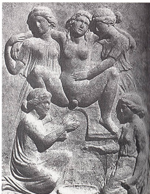
Faux bas-relief grec en marbre de style classique représentant une scène d'accouchement particulièrement étonnante: Elle montre explicitement la nudité, le ventre gonflé de la future mère et, de surcroît, la scène de l'expulsion, ce qui est tout à fait contraire à la mentalité grecque. Collection privée suisse

LORSQU'ON évoque l'Antiquité classique, on a souvent tendance à considérer la Grèce ancienne et la Rome antique comme une seule et grande époque de l'histoire, sans véritablement prendre conscience des différences culturelles existant entre ces deux civilisations. Bien que très proches les uns des autres, les Grecs et les Romains n'ont pourtant pas toujours regardé du même œil le monde qui les entourait. Ce regard différent que l'on perçoit notamment dans l'art et l'artisanat reflète les modes de pensées et de comportements de chacune de ces sociétés.