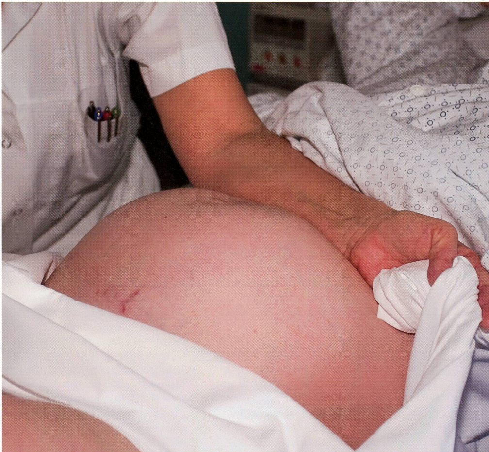
Un «Kristeller» avec l'avant-bras.