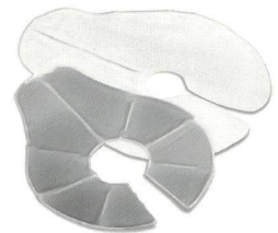
Das Temperature Pack

bieten Sie Ihr doch diese praktischen Produkte an.