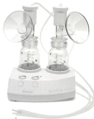
Model: Lactaline Personal

...und Ihr das Stillen noch angenehmer zu machen,