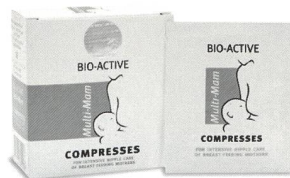
Die Multi-Mam Kompressen