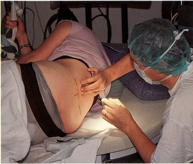
Jede zweite Gebärende bekommt heute eine rückenmarksnahe Anästhesie.