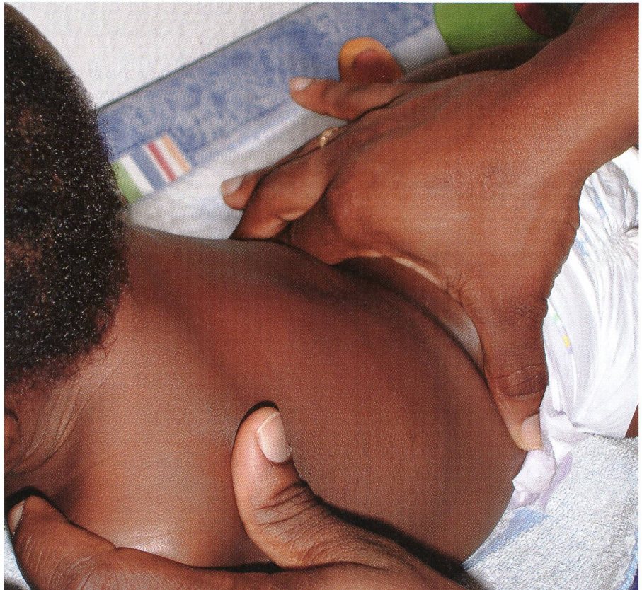
Le massage démarre toujours par le dos et les mères africaines utilisent souvent de l'huile.