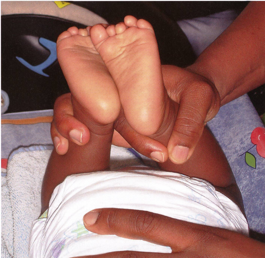
Les manipulations sont systématiquement poursuivies, même si le bébé africain se met à pleurer.

nous retrouvons l'effleurage et sur le nez, le pincement.