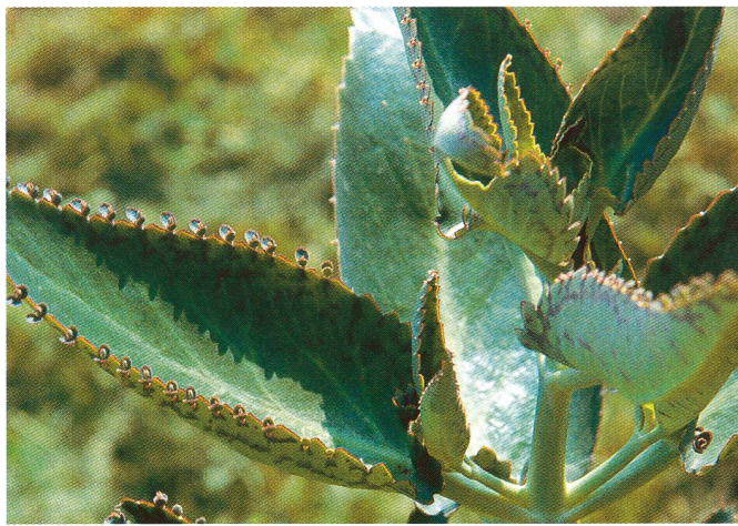
Die unscheinbare Pflanze Bryophyllum gilt auch als «pflanzliches Valium».

Diese Studien wurden durch Beiträge der Weleda AG Arlesheim massgeblich gefördert.