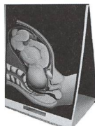
Neuerscheinung: der Geburtsatlas in Deutsch

•Fon: +49 6165 912 204 •Fax: +49 6165 912 205 •E-Mail: info@rikepademo.de •Internet: www.rikepademo.de