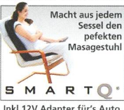
Inkl. 12V Adapter für's Auto.

„Massiert wie die echten Hände!“ Die tiefwirkende Shiatsu Knetmassage stimuliert und stärkt die Rückenmuskulatur . Die äusserst sanfte Rollmassage regt Blutkreislauf und Lymphdrainage an. Die zuschaltbare, wohlthuende Wärmefunktion intensiviert die Tiefenwirkung der Massage noch zusätzlich. Die Vibrationsmassage wirkt muskelentkrampfend und fördert auch die psych. Entspannung . Und mit Swing lässt sich Ihr Chi-Fluss aktivieren und harmonisieren. 2 Jahre Garantie.