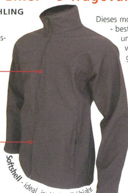
Softshell - Ideal im Herbst/Frühjahr