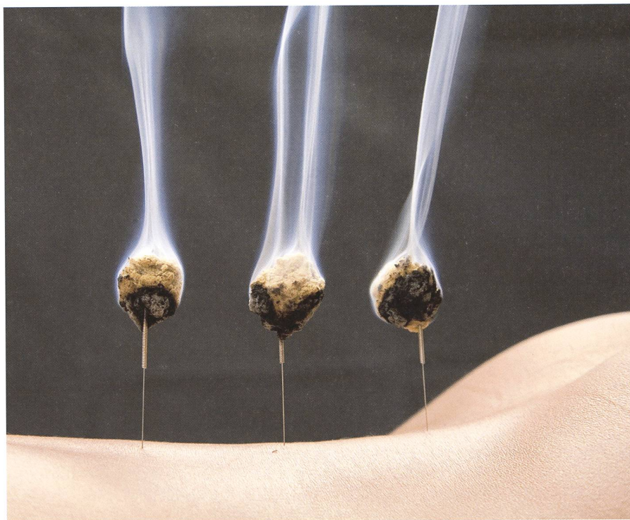
Les bâtons de moxa précarbonisés produisent moins de fumée.

Par ailleurs, il serait important de comprendre et de rechercher les raisons des différences entre les études qui montrent un effet du traitement et celles qui y échouent. La technique, la méthode, ainsi que l'âge gestationnel au moment de l'intervention pourraient expliquer ces différences. ◀