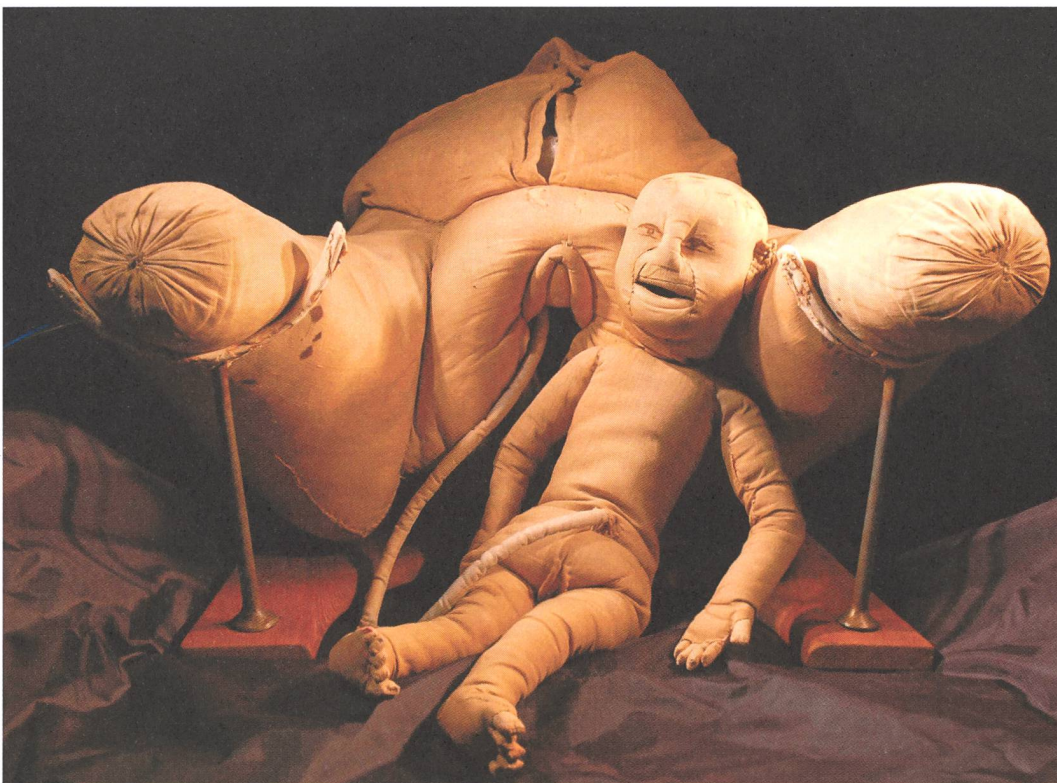
Abb. 1 Das Phantom von Angélique du Coudray

A Göttingen (Allemagne), Friedrich Benjamin Osiander (1759-1822) utilisait un «fantôme» semblable mais il était installé en position couchée avec une poupée simulant l'enfant, le tout caché derrière un rideau. Ce système d'entraînement servait non seulement durant les cours, mais aussi lors de véritables accouchements: les étudiantes allaient donc examiner de vraies parturientes puis revenaient vers Osiander qui complétait ses explications. Il tenait ainsi à ce que ses patientes servent de «fantômes vivants» pour l'apprentissage des gestes obstétricaux.