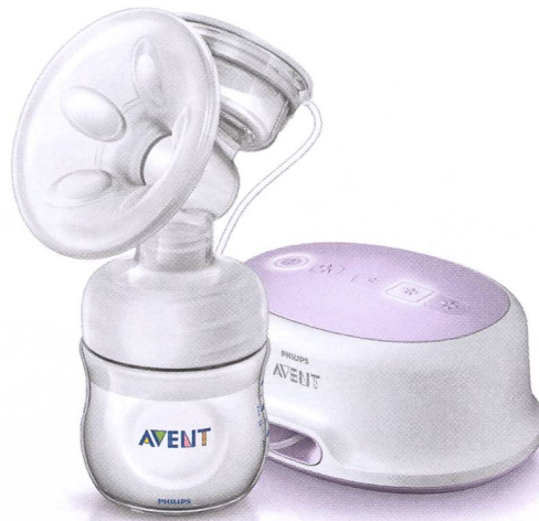
Tire-lait électrique Natural