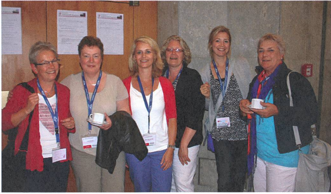
Hebammen in den Niederlanden sind im Gesundheitssystem und bei den Frauen etabliert und akzeptiert.

Arbeitsweisen kennenzulernen und diejenigen hierzu neu zu schätzen, da in vielen Ländern für Frauen und Hebammen immer noch schwierige und schwierigste Rahmenbedingungen bestehen.